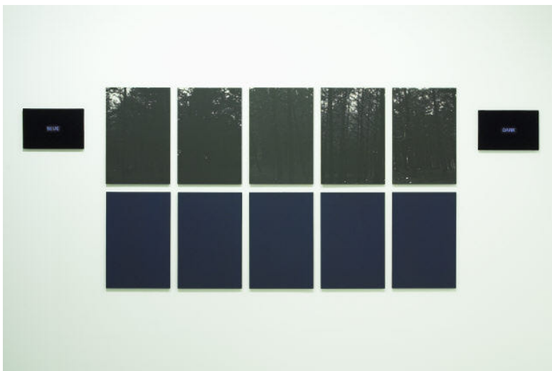
Night Works #67 , 1977. Técnica mista sobre madeira, tela e veludo. 138x356 cm. Col. FCG/CAM