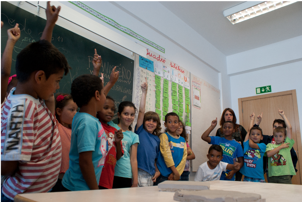
Imagem: Bruno Mendes

MRC : E o que querará dizer “inter”, conhecem outras palavras que comecem por “inter”?