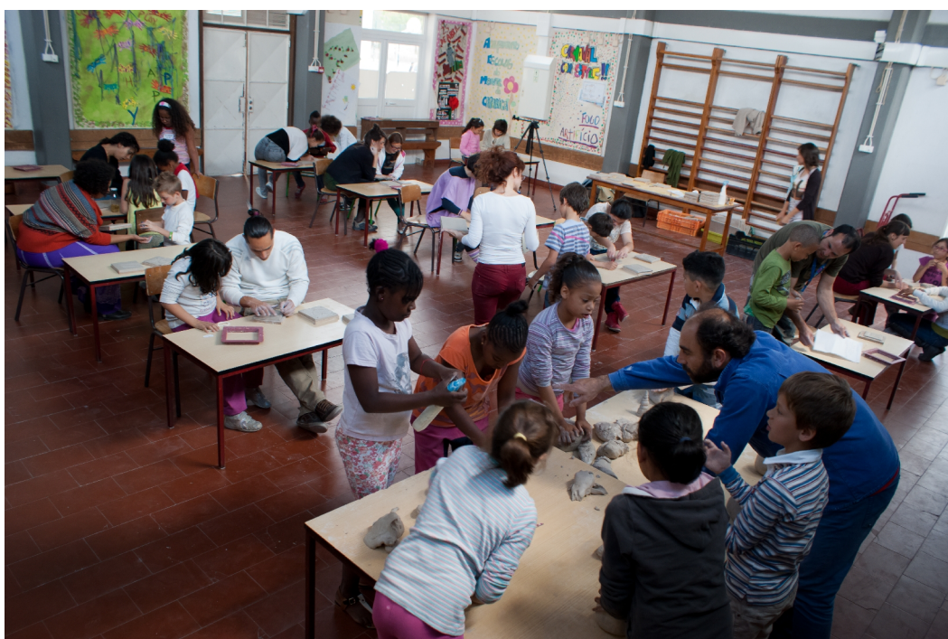
Imagem: Bruno Mendes